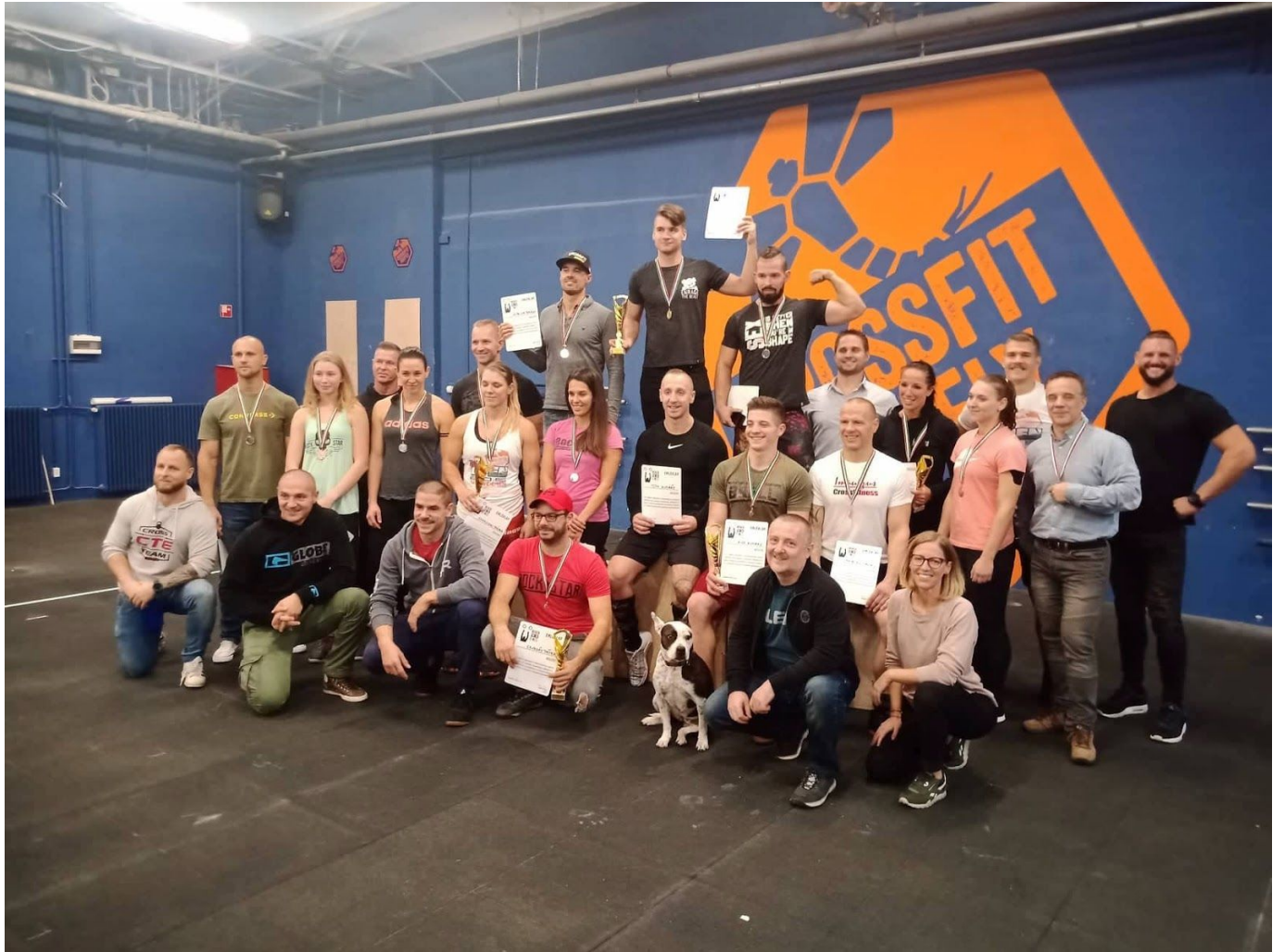
Az első országos hivatalos szövetségi versenyünk: "NEFFISZ JUMP START"

Még szintén novemberben megvalósítottuk az első országos hivatalos NEFFISZ szövetségi versenyt JUMP START elnevezéssel.